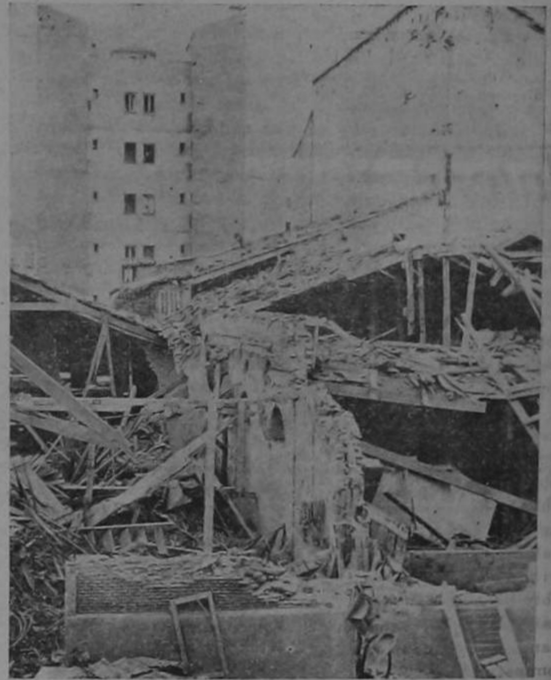
A building in Madrid destroyed by the bombing planes of the Nationalists, it was occupied by government troops. The adjoining building in which the soldiers slept was also damaged. Many lives were lost.

You can sew with it backward and forward, do embroidery, mending and hemstitching work. We exchange your old machine for this wonderful new one. ONLY 15 COLONES PER MONTH. «Singer» Agency at the North side of the Market in Limón.