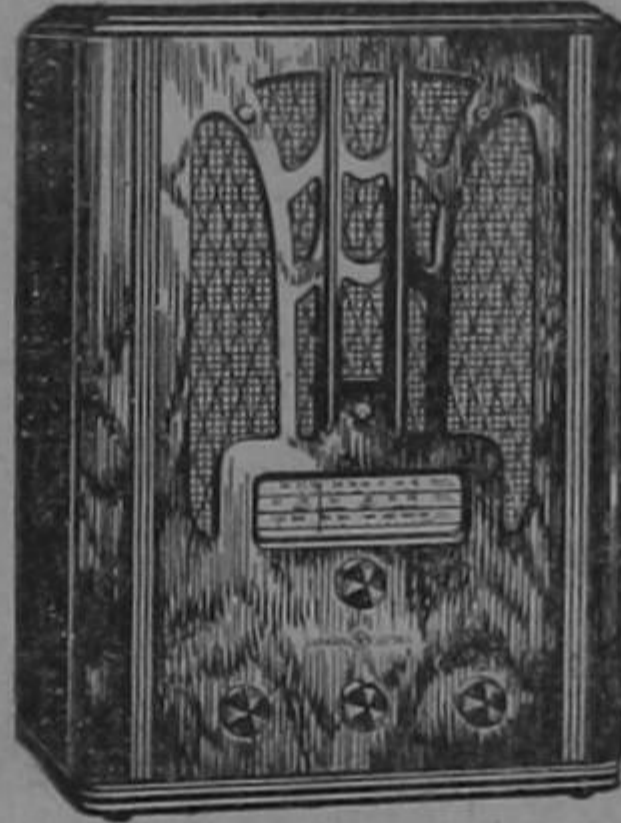
RADIO G. E. MODELO E-81

La rara belleza de sus muebles constituye la nota característica de la serie 1936-1937 de radios General Electric, debida al genio creador del propio estilista de la G. E., uno de los dibujantes industriales de más renombre en los Estados Unidos.