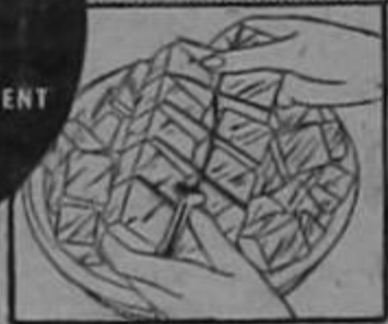
Plenty of ice cubes with Electrolux

RUNS ON KEROSENE (COAL OIL) WITHOUT MACHINERY NEEDS NO ELECTRIC CURRENT NO DAILY ATTENTION